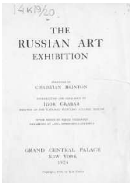
Обложка каталога выставки «Русское искусство», НБ ГТГ