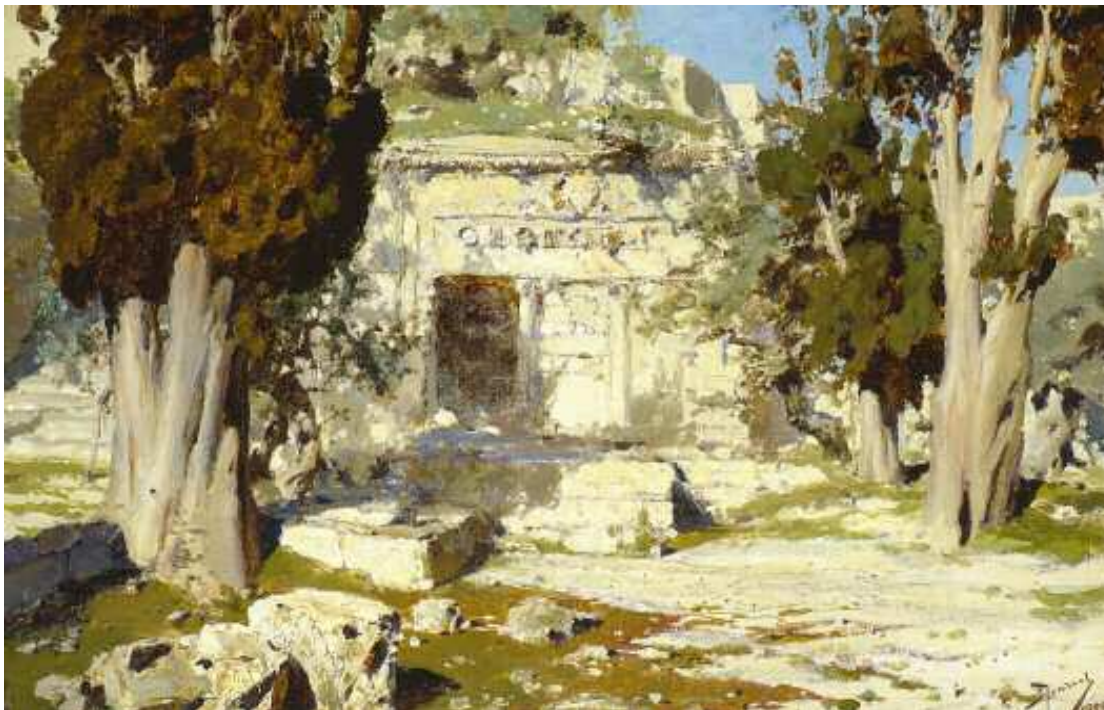
Харам-эш-Шериф. Часть двора. 1882 Холст, масло 30,5 × 46,5 ГТГ

Al-Haram ash-Sharif [Noble Sanctuary]. A Detail of the Courtyard. 1882 Oil on canvas 30.5 × 46.5 cm Tretyakov Gallery